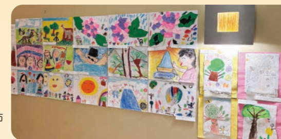
▶米国スプリングフィールド市庁舎等に展示