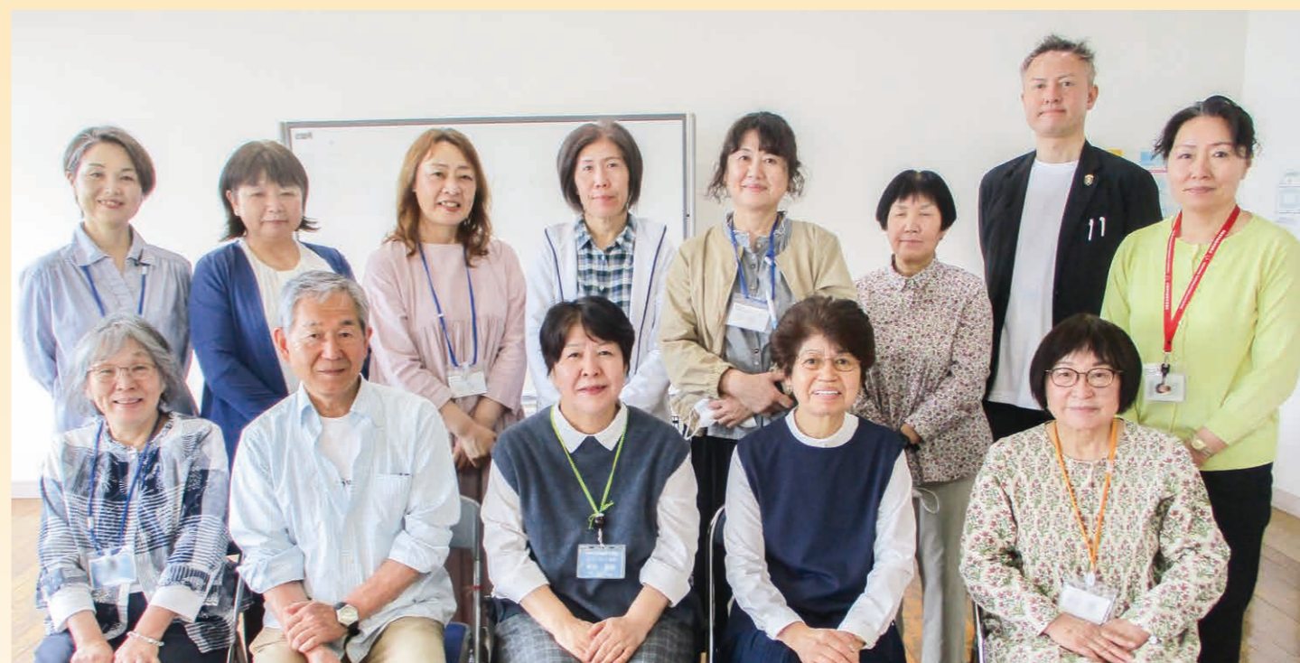
▲令和6年度日本語教室の講師のみなさん

これまで、多くの人たちが希望の翼に乗って交流を深めてまいりました。そして、海を渡って多くの友情と深い信頼の絆が結ばれてきました。未来に向けて国内外を問わず、多くの人たちと交流が続くことを願っています。