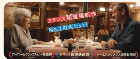
▲上映作品「パリタクシー」（2022年：フランス）

海外の映画鑑賞を通じて、国際交流協会会員の国際理解を深めるため、令和6年2月2日にMOVIX伊勢崎（スマーク伊勢崎内）にて国際映画祭を開催しました。91人の方々が集まり、フランス映画を鑑賞しました。