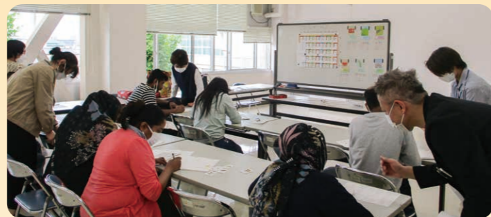
▲優しく指導する講師のみなさん