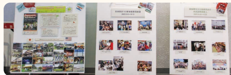
▲映画祭に合わせてミニ国際交流パネル展でR5年度の活動を紹介