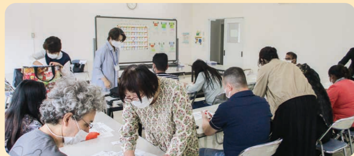
▲日本語教室の様子

日本語と生活ルールを学ぶため、市内に在住・在勤している16歳以上の外国人住民を対象として、年3期、毎週日曜日、緋の郷で日本語教室を開催しています。