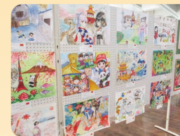
◀左から伊勢崎市児童、スプリングフィールド市児童、馬鞍山市児童の作品