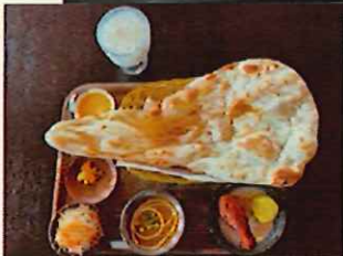
しゃしん いめーじ ※写真はイメージです。