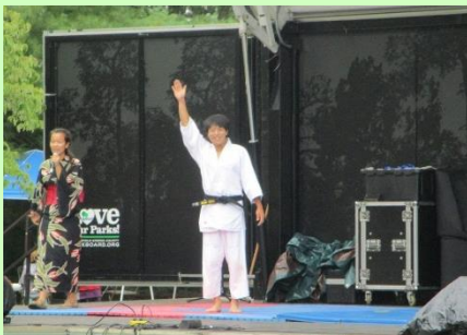
柔道パフォーマンス Judo demonstrator