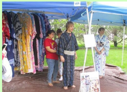
Kimono try-on 着物着付け体験