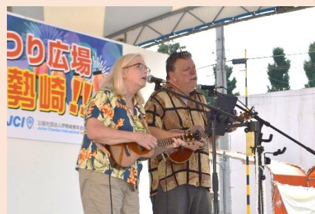
いせさきまつりコンサート Isesaki Summer Festival