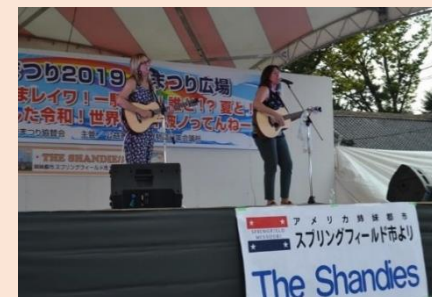
いせさきまつりコンサート Isesaki Summer Festival