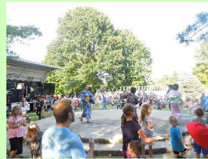
来場者で日本の盆踊り Japanese traditional dance