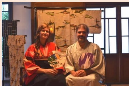
着物着付け体験 Kimono try-on experience