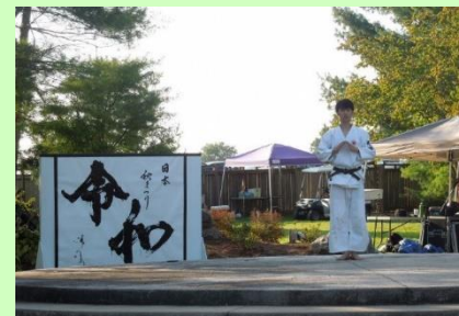
日本拳法パフォーマンス Nihon Kenpo demonstrator