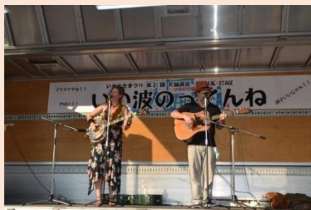
いせさきまつりコンサート Isesaki Summer Festival