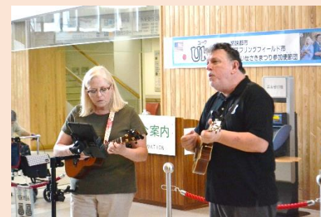
市民病院コンサート municipal hospital