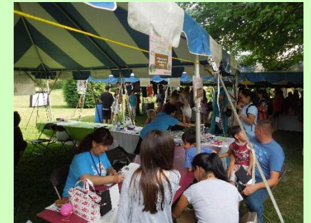
ワークショップ Hand made craft