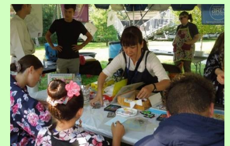
ワークショップ Hand made craft