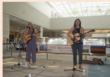
商業施設コンサート Shopping mall