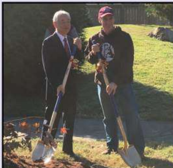
Planting a maple tree in honor of 30 years as a sister city