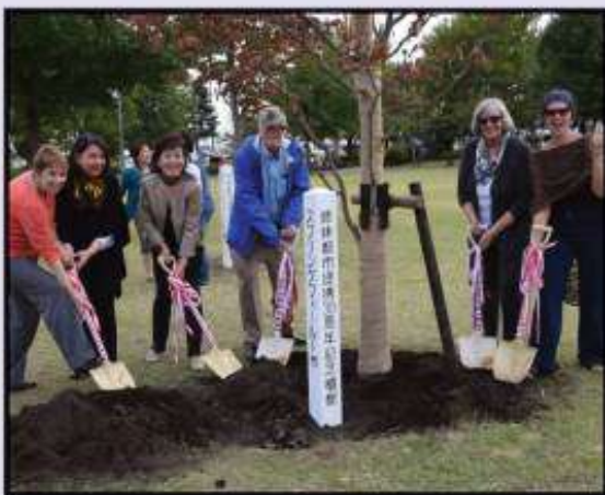
30th anniversary tree planting