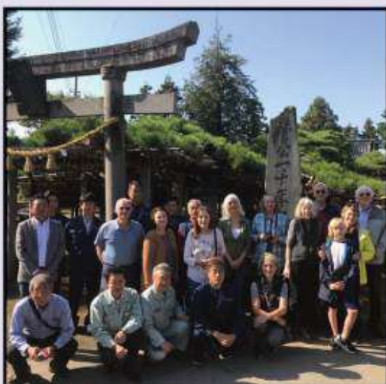
Isesaki gardeners tour